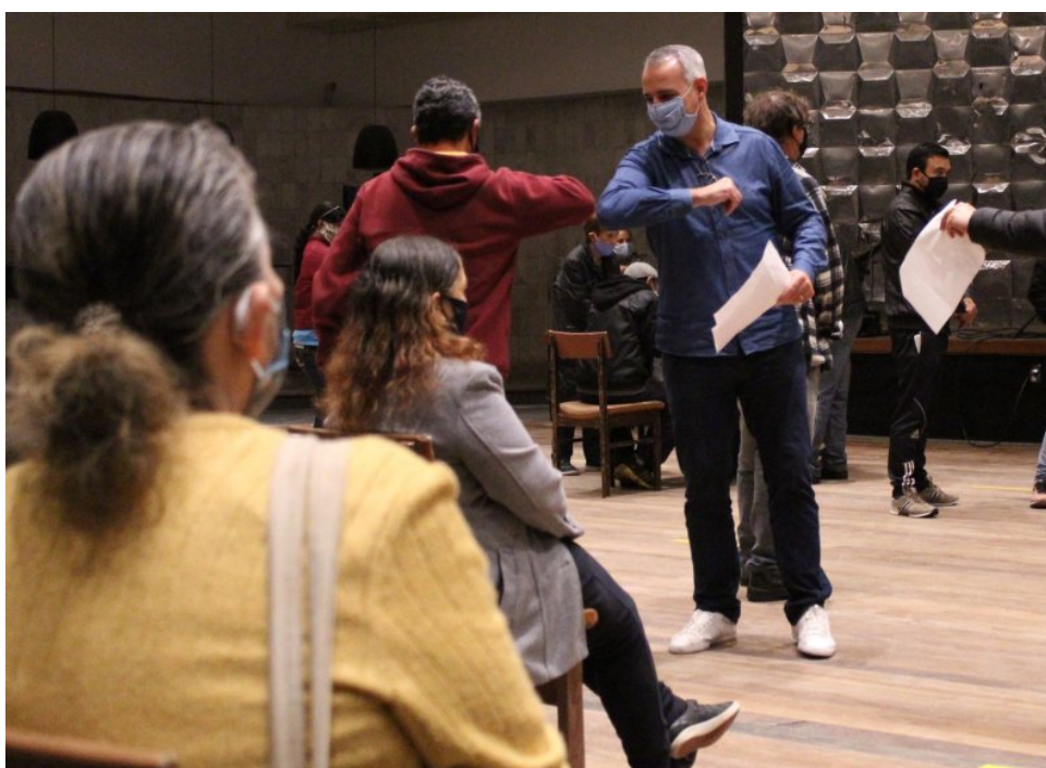
Esquema de entrega foi montado a fim de respeitar o distanciamento e evitar aglomerações.

Por Manuela Vasconcellos / Prefeitura de Santa Maria